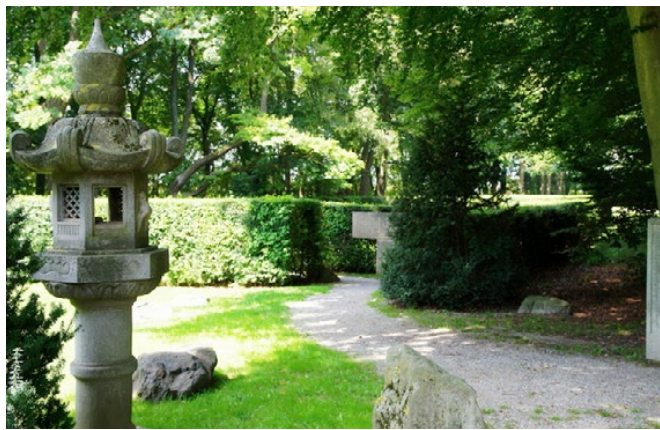
Wittelsbacher Park