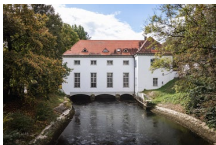
Kraftwerk am Wertachkanal